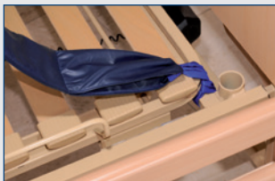
Bettzüge mit Verlängerungsschlaufe