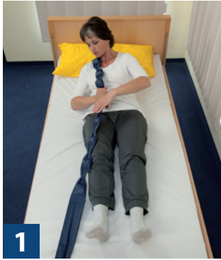
Bettzüge ohne Unterstützung