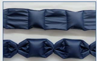
Bettzüge mit geraffelten Zwischenräumen