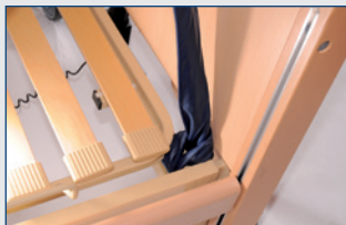
Bettzüge ohne Verlängerungsschlaufe